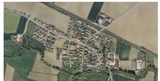
Digitales Orthophoto (DOP) von Mangolding (entzerrtes Luftbild)

Auf dieser 1000-Jahrfeier werden wir ebenfalls rund um die amtliche Grundstücksvermessung kompetent und fachkundig beraten. Neben den diversen Produkten der Bayer. Vermessungsverwaltung wird dabei die Waldgrenzermittlung ein Schwerpunktthema sein.