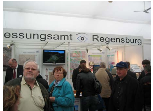
Unser Stand auf der dona 2008

Darüber hinaus wird es ein Preisrätsel mit interessanten Gewinnen, ein begehrtes 2x2 Meter großes Luftbild von Regensburg und Fluganimationen (animierte Rundflüge am PC) geben.