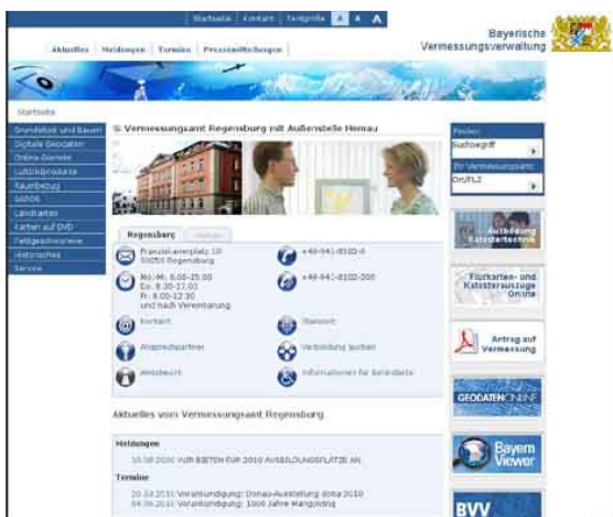
Internetauftritt des Vermessungsamtes Regensburg - Startseite

Besonderes Augenmerk wurde auf den Punkt „Barrierefreiheit“ gelegt. So erlaubt die neue Homepage unterschiedliche Schriftgrößen und nahezu alle Bilder wurden mit Beschreibungstexten versehen. „Wir messen der Zugänglichkeit für Behinderte große Bedeutung bei. Gleichwohl sind wir uns bewusst, dass an diesem Punkt noch weiter gearbeitet werden muss“, so Ministerialrat Peter Lauber vom Bayerischen Staatsministerium der Finanzen.