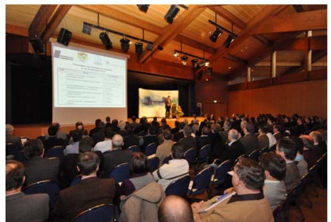
Blick in die vollbesetzte Stadthalle von Neutraubling

Ein Schwerpunkt der Veranstaltung lag in der Präsentation der neuen Möglichkeiten von GeodatenOnline.